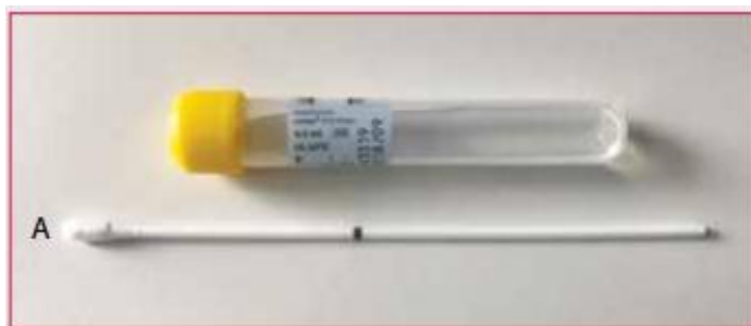
PCR set (transportná skúmavka žltá)